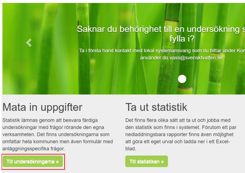
Figur 1. Aktuella undersökningar hittas via "Till undersökningarna" på startsidan.

För att komma till sidan för aktuella undersökningar i VASS använder du knappen Till undersökningarna på startsidan, se markering i figur 1.