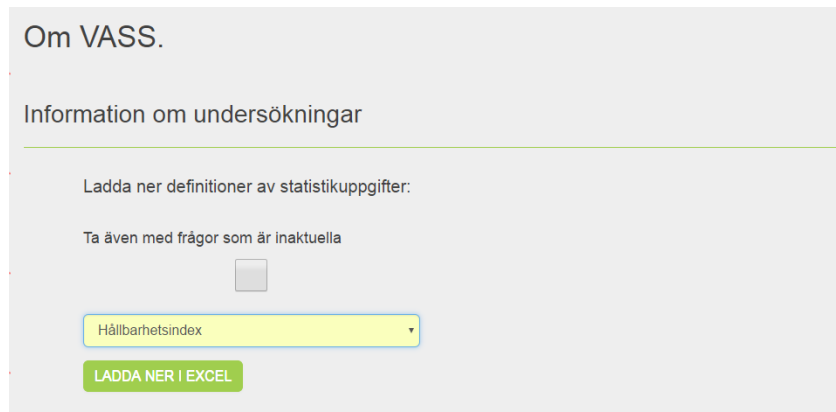
Figur 2. Excelfil med definitioner finns under avsnitt "Information om undersökningar".

Under avsnitt Användarmanualer finns ett antal dokument och filer för stöd vid inmatning av uppgifter. Se figur 3.