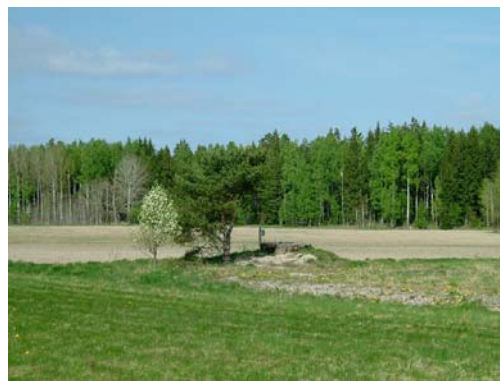
Himmeta grävd brunn