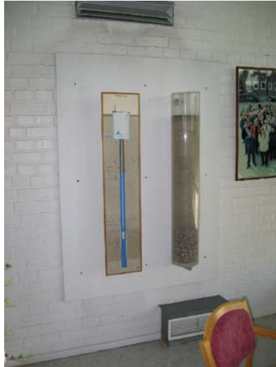
Ett filter i genomskärning

Vattnet hämtas från Köpingsåsen. Produktion ca 2 624 700 m 3 per år. Ett prov togs på utgående vatten inne på vattenverket. Analysresultat, se tabell 2, 3 och 4 (bilaga 1).