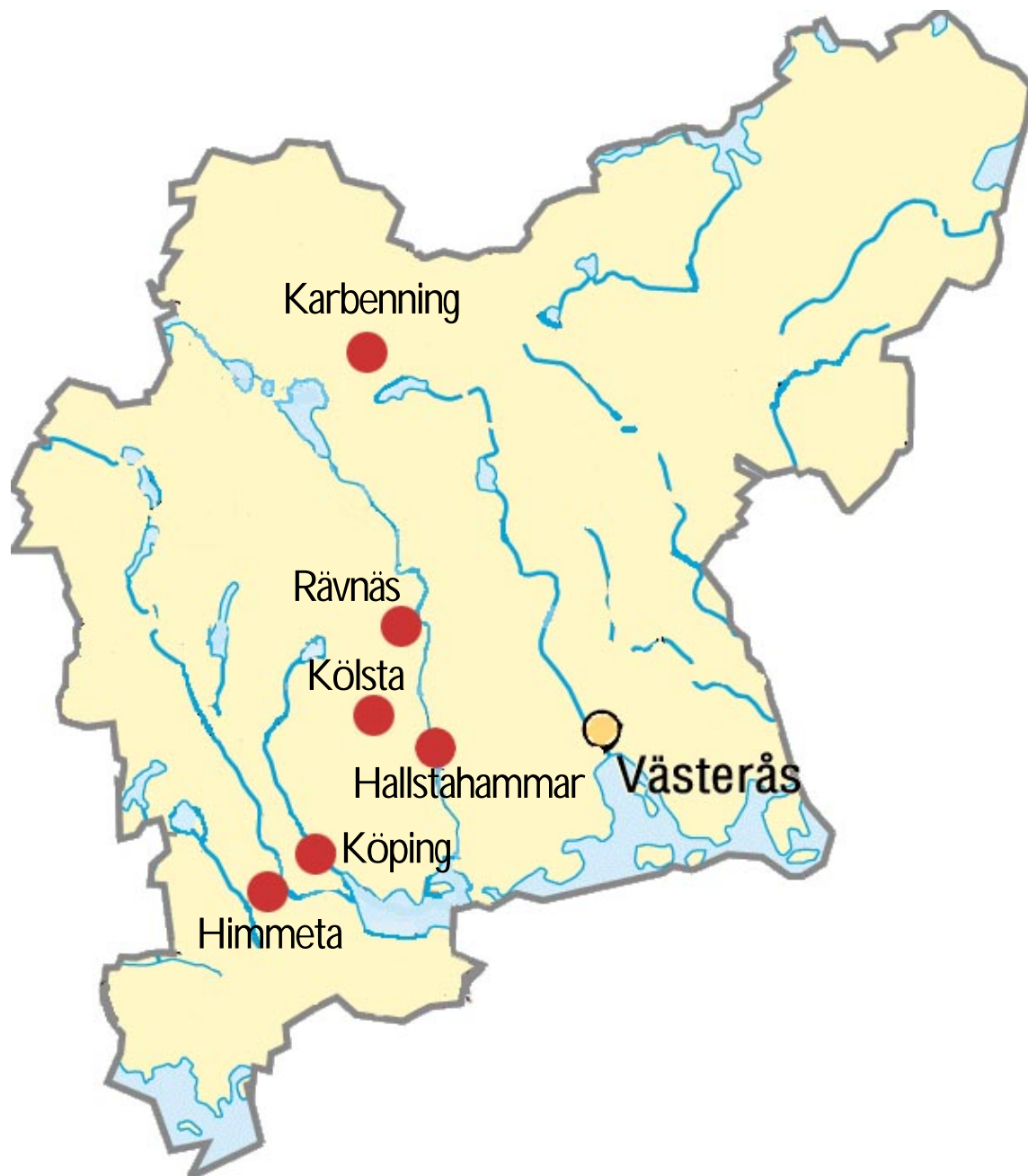
Figur 1. Vattentäkter i Västmanlands län som ingått i SSI:s undersökning.