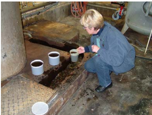
Karbenning uppsamling av material från backspolning