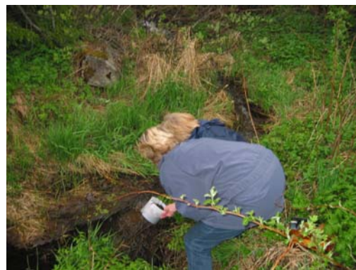
Avfallsprov vid utloppet i diket.