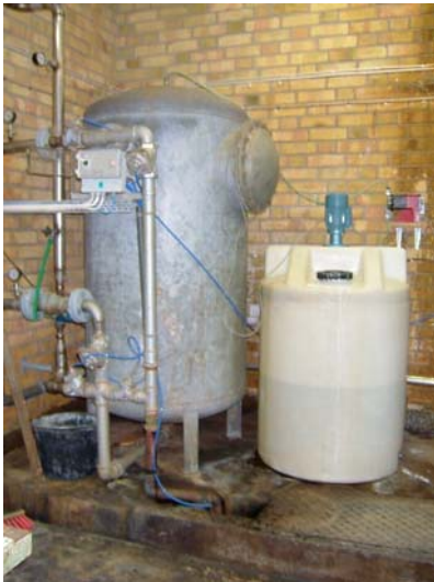
Karbenning cistern med filter

Produktion år 2001, ca 16 000 m 3 råvatten. Karbenning är en bergborrad grundvattentäkt med höga halter av järn och mangan i råvattnet, filtrering görs genom ett filter bestående av ett gruslager, sandlager och ett järn- och manganfilter (alkalisk massa) och överst luft. Därefter får vattnet passera genom en radonavskiljare (Radonett). Gammastrålningen mätt utvändigt på cisternen med filtret ligger mellan 0,25 – 1,0 µSv/h. Avfallet från backspolningen rinner ut i ett dike, gammastrålningen vid själva utloppet uppmättes 0,5 – 1,5 µSv/h. Analysresultat, se tabell 2, 3 och 4 (bilaga 1).