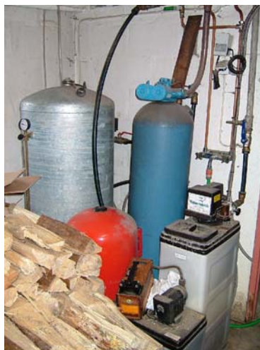
Filteranordningen i en privat bostad

Resultaten redovisas också i figur 2A och 2B. Av dessa framgår att halterna av uran, radium och radon varierar mellan olika provtagningar. Särskilt markant är haltvariationen för radon. Vad variationen beror på är inte utrett, men det är vanligt att kraftiga variationer förekommer i grundvatten som tas från bergakviferer. Figurerna visar också hur filtren i samverkan avlägsnar uran och radium från vattnet.