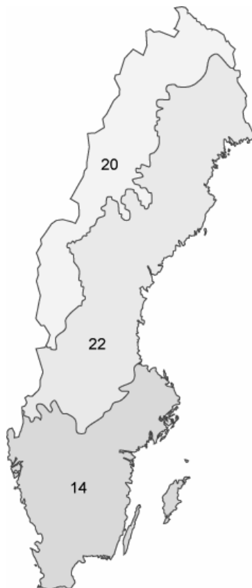
Figur 4.1. Illies ekoregioner, Centralslätten (14), Fennoskandiska skölden (22) och det Boreala höglandet (20).

Konsoliderad elektronisk utgåva Uppdaterad 2019-01-01